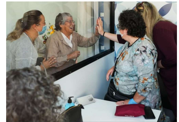
BOX das Emoções instalada num Lar e em funcionamento