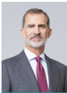
Su Majestad el Rey Don Felipe VI