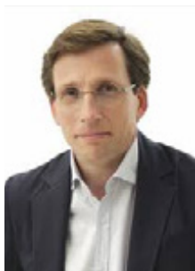
Excmo. Sr. D. José Luis Martínez-Almeida Navasqués Alcalde de Madrid